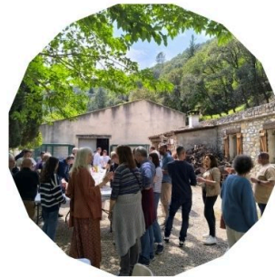
Repas partagé avec la délégation de Campins. Nos amis catalans ont découvert l'alligot

Fête de la Nature : relâché de hérissons dans le cirque du Bout du monde.