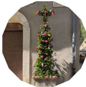
Fête de la croix